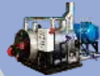
Hot Water Boiler