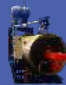
Hot Oil Boiler